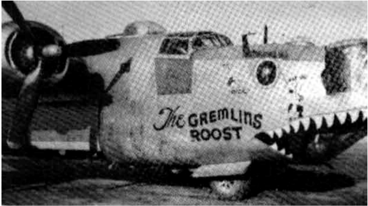
B-24-J-401-CF Liberator 42-50505 93 rd BG 330 th BS "The Gremlins Roost"