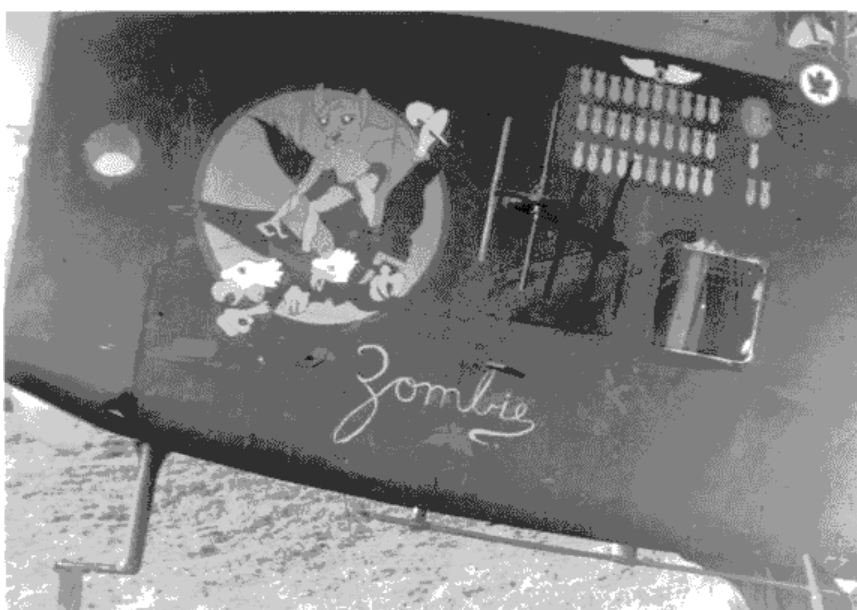
Halifax NP774 QO-Z 432 Sqn