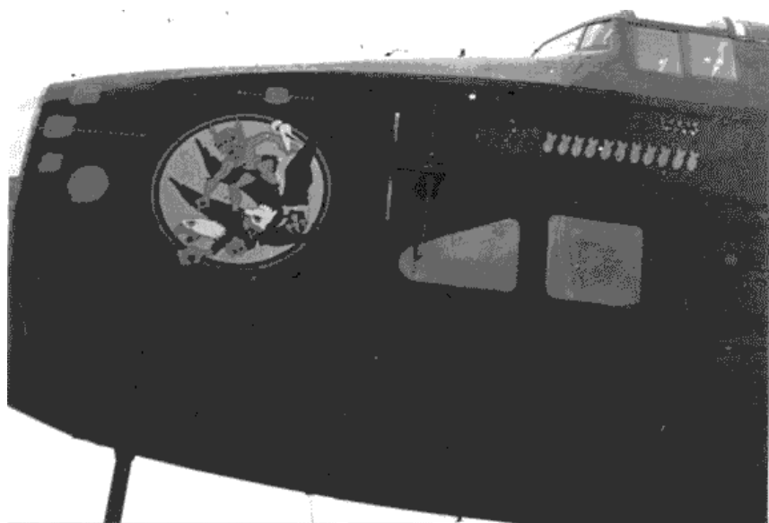
Halifax MZ582 QO-Z 432 Sqn

Deux Halifax codés respectivement NP774 QO-Z et MZ582 QO-Z du 432 Sqn reproduisent l'emblème du 339 th FS 347 th FG "Gremlin on a Double-Eagle". Noter l'utilisation du terme "Zombie" au lieu de "Gremlin".