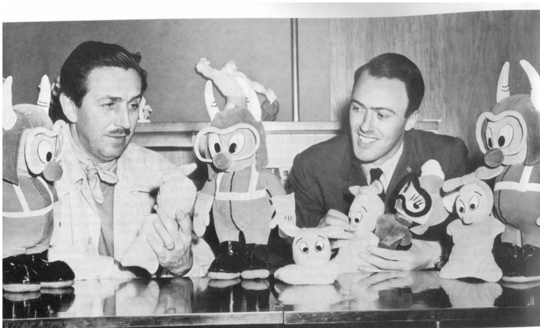
Walt Disney et Roald Dahl posant avec la Famille "Gremlin"