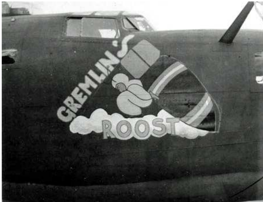
B-24-H-15-CF Liberator 41-29601 486 th BG 832 nd BS "Gremlin's Roost"

B-24-H-1-FO Liberator 42-7512 445 th BG 703 rd BS "Gremlin Roost" B-24-H-15-CF Liberator 41-29601 486 th BG 832 nd BS "Gremlin Roost" B-24-L-10-F0 Liberator 44-49577 579 th BS 392 nd BG "Gremlin Roost" B-24-J-401-CF Liberator 42-50505 93 rd BG 330 th BS "The Gremlin Roost"