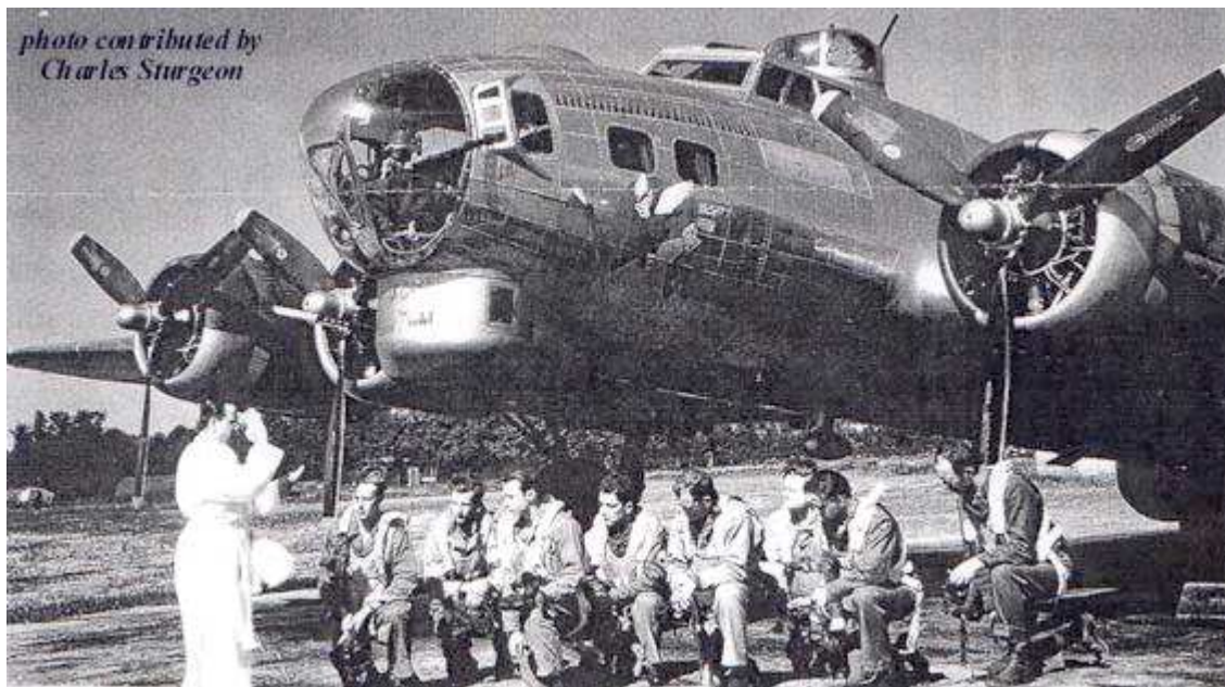
B-17G-35-DL Fortress 42-107030 91 st BG 322 nd BS "Fifinella"

En choisissant les "Gremlins" comme mascotte peinte sur le fuselage de leur avion, les équipages pensaient-ils conjurer le sort et éviter les tirs de la DCA adverse ? Serait-ce